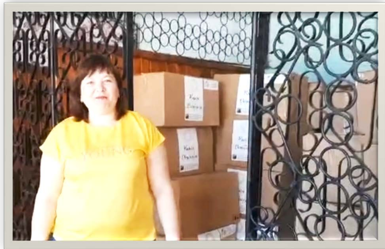
Краснодонская СОШ № 8 имени защитника ЛНР Виталия Парсанова (г. Краснодон)